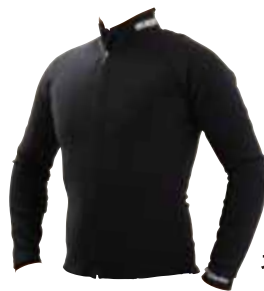
ネオプレンシャツ オーダー