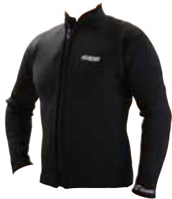
鮎トップガード ジャケット オーダー

※太い赤枠内は必ず全てご記入ください。なお採寸は必ず素肌状態で採寸してください。採寸ミスによる手直しは、料金が発生いたしますのでご注意ください。