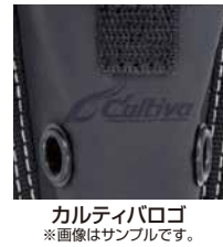
カルティバロゴ ※画像はサンプルです。