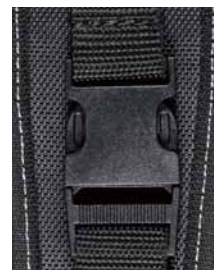
長さ150mm、幅25mmのベルトにバックル固定仕様