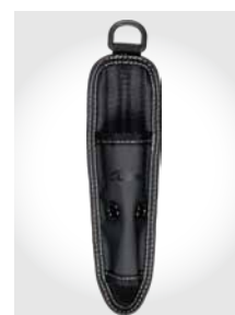
シンプルな挿入感