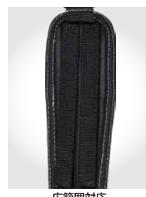
広範囲対応 150mmツインベルクロ