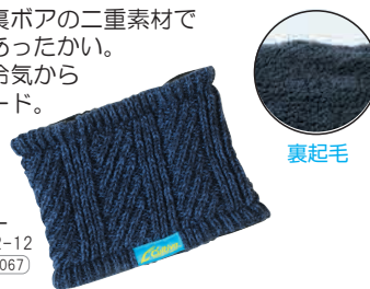
ネイビー No.9942-12 JANI 374067

表ニット、裏ボアの二重素材で肌触り良くあったかい。首元や耳を冷気からしっかりガード。