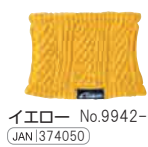
イエロー No.9942-05 JANI 374050