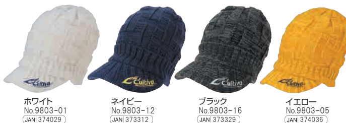
ホワイト No.9803-01 JANI 374029